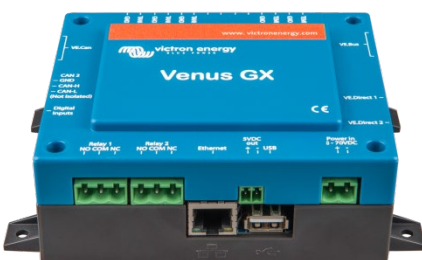
Venus GX etuviistosta