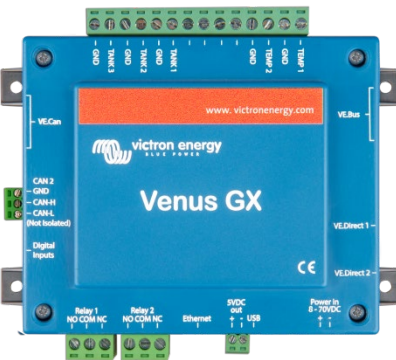
Venus GX liittimet